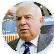
Президент Лазерной ассоциации России Н.Н. Евтюхийев

«Широкое практическое освоение технологий фотоники является необходимым для социально-экономического развития нашей страны – об этом свидетельствует и мировой, и отечественный опыт, и мы надеемся, что 19-я выставка «Фотоника. Мир лазеров и оптики» так же, как и все предыдущие, будет активно способствовать такому освоению».